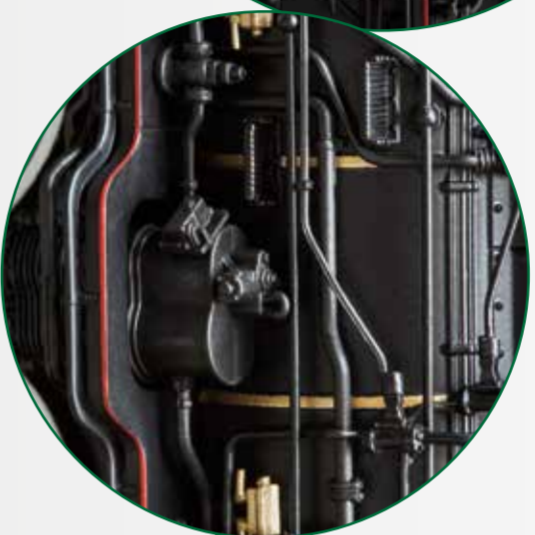
Äußerst filigrane Leitungsführung wie am Original Intricate piping like the original