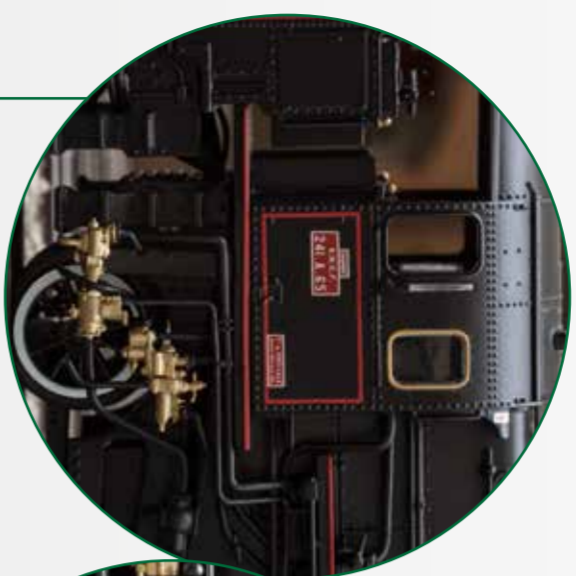
Auch auf den zweiten Blick... Schönheit mit vielen goldfarbenen Details Beauty with many gold-colored details

The massive class 241 A steam locomotives appeared on French rails at the start of the Thirties. In the “golden” era of travel before World War II, they pulled heavy express trains between Paris and the Atlantic ports of Cherbourg and Le Havre as well as between Paris and Basel. There the famous Arberg Orient Express was part of their tasks. After the end of the war, they ran until 1965 mainly between Paris and Strasbourg as well as Paris and Basle. Road number 241 A 1 in the Mulhouse Railroad Museum as well as road number 241 A 65 in Switzerland remain preserved, the latter as the largest operational steam locomotive in Europe.