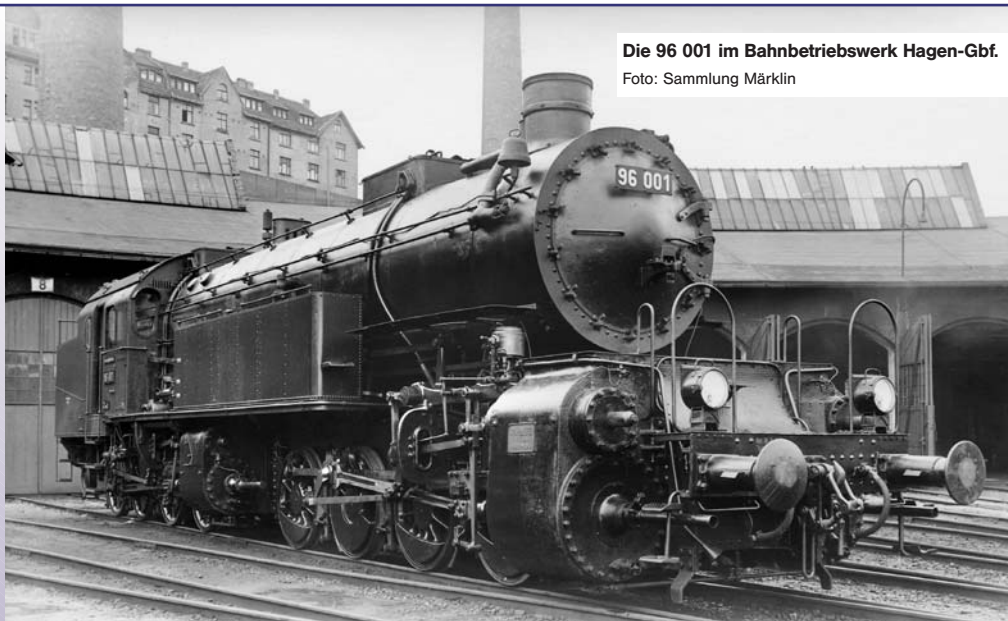
Die 96 001 im Bahnbetriebswerk Hagen-Gbf.

Modell: Aufbau und Fahrgestell weitgehend aus Metall, verschiedene Anbauteile aus jeweils geeigneten Materialien. Digital-Decoder mfx, geregelter Hochleistungsantrieb und Geräuschgenerator mit vielen Funktionen. Betrieb mit Wechselstrom, Gleichstrom, Märklin Digital und Märklin Systems möglich. 8 Achsen in beiden Fahrwerksgruppen angetrieben. Eingebauter Rauchsatz. Zweilicht-Spitzensignal mit der Fahrtrichtung und Rauchsatz konventionell in Betrieb, digital schaltbar. Viele Betriebsfunktionen und Geräusche mit Control Unit oder Systems schaltbar. Systemkupplung austauschbar gegen beiliegende Schraubkupplung. Gleisbogen befahrbar ab Mindestradius 1020 mm. Länge über Puffer 54,8 cm.