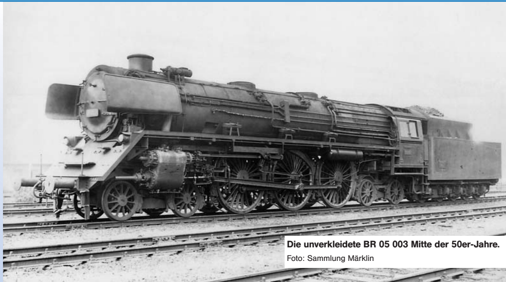
Die unverkleidete BR 05 003 Mitte der 50er-Jahre.

Modell: Mit Digital-Decoder mfx, geregelter Hochleistungsantrieb C-Sinus und Geräuschgenerator mit vielen Funktionen. Wartungsfreier Motor in kompakter Bauform im Stehkessel. 3 Achsen angetrieben. 2 Haftreifen. Beleuchtung mit wartungsfreien Leuchtdioden. Spitzensignal konventionell in Betrieb, digital schaltbar. Rauchsatz 7226 nachrüstbar. Viele Betriebsfunktionen und Geräusche mit der Control Unit bzw. Systems oder der Central Station schaltbar. Tender aus Metall. Feste Kurzkupplung zwischen Lok und Tender, hinten NEM-Aufnahme mit Kurzkupplung. Befahrbarer Mindestradius 360 mm. Ansteckbare Kolbenstangenschutzrohre. Länge über Puffer 30,7 cm.