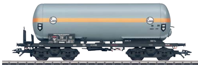
Jahreswagen 2007 in H0