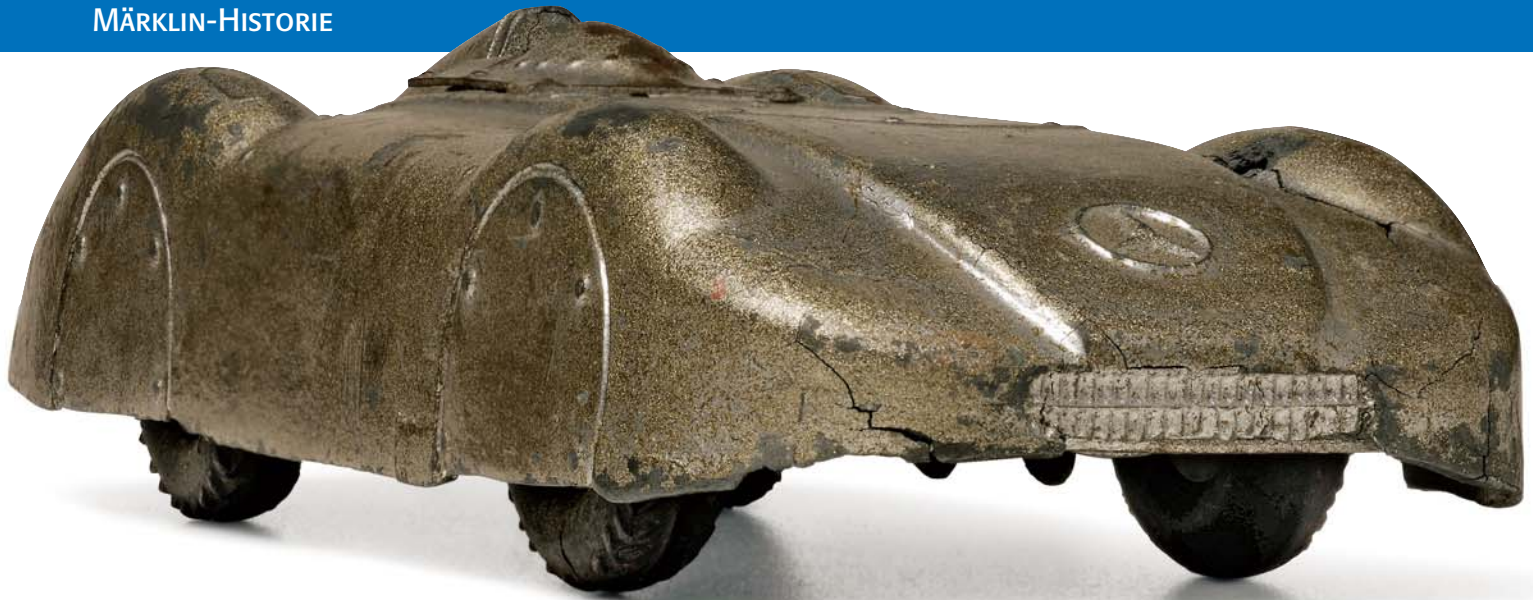
Diesen Mercedes-Benz-Rennwagen 5521/15 fertigte Märklin von 1937 bis 1940. Die Spuren des Alters sind hier deutlich zu erkennen.