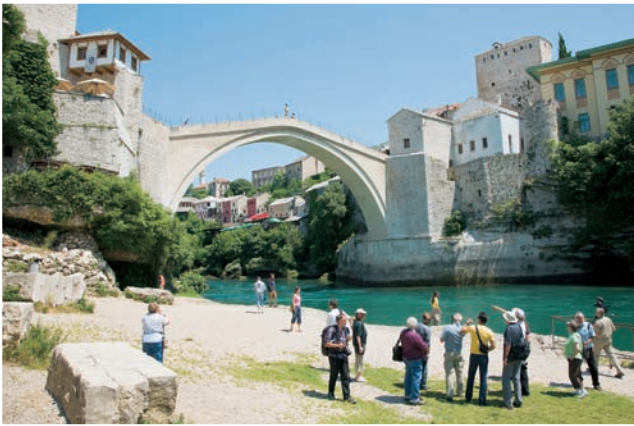
Stari Most. Besichtigung der neuen »Alte Brücke« von Mostar.

Mit Dampf- und Regelzügen durch Slowenien, Kroatien, Bosnien-Herzegowina und Serbien.