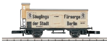
Die beiden ersten Insider-Jahreswagen aus dem Jahre 1993.