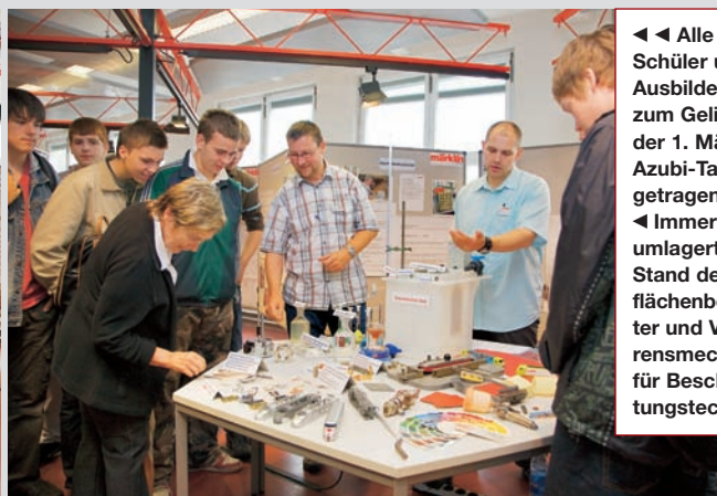
◀ ◀ Alle Azubis, Schüler und Ausbilder, die zum Gelingen der 1. Märklin-Azubi-Tage beigetragen haben. ◀ Immer dicht umlagert: Der Stand der Oberflächenbeschichter und Verfahrensmechaniker für Beschichtungstechnik.