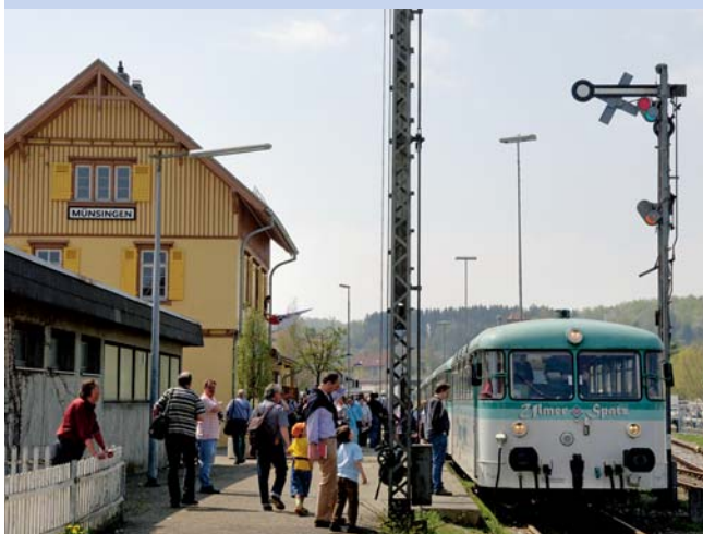
Oben: Im »Schritttempo« wurden solche ungesicherten Bahnübergänge passiert ♦ Links: während eines Halts im Bahnhof Münsingen erfrischte man sich mit Sekt und Orangensaft ♦ Unten: Matthias Richter hatte als Zugführer alles im Griff.