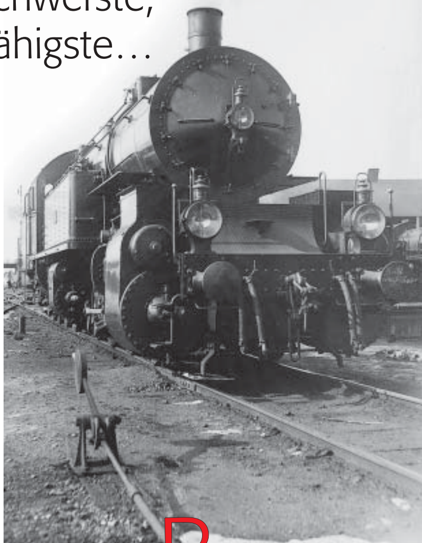
Gt2x4/4 5774, die spätere 96024, im Jahre 1925 im Bw Pressig. Auf dem linken Puffer sieht man die Kreidaufschrift »bleibt im Feuer«

Steilstrecken stellten die Bahnen schon immer vor große Herausforderungen. Das Rad-Schiene-System verträgt nur mäßige Steigungen. Anfangs behalf man sich auf zahlreichen Relationen mit dem aufwendigen Zahnradbetrieb. Im zweiten Jahrzehnt des 19. Jahrhunderts gelang es, ausreichend leistungsfähige Maschinen für den Reibungsbetrieb zu entwickeln.