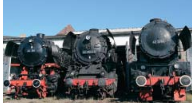
Es gibt im BEM noch viel zu restaurieren und – genügend Übungsdampflok.