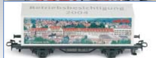
Der Betriebsbesichtigungswagen hat zwei unterschiedlich bedruckte Seiten