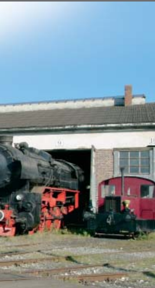
Das »Zugpferd« beim BEM: Die S3/6 in ihrem rekonstruierten Originalanstrich.