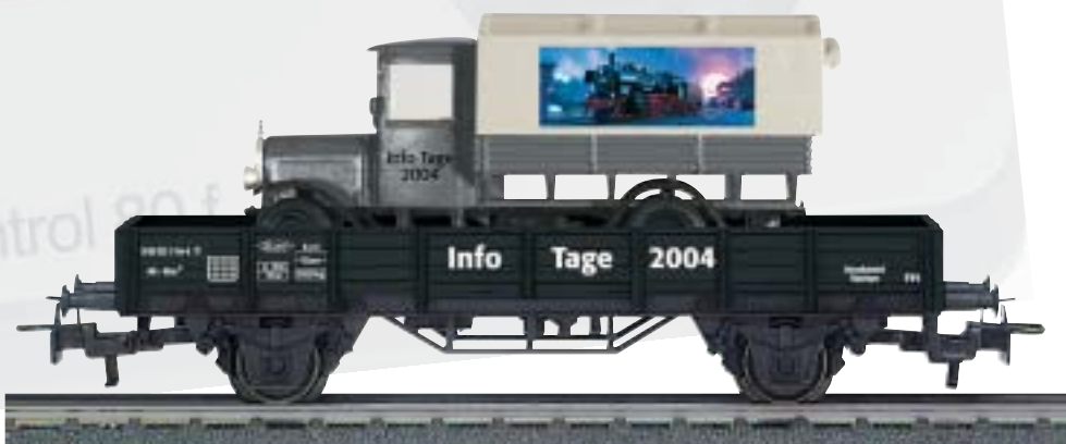
Infotag-Wagen 2004: Alle Märklin-Händler, welche Infotage veranstalten, können den Infotag-Wagen (H0) zum Veranstaltungstag bestellen. Das Angebot gilt während des Infotages jeweils solange der Vorrat reicht.

Falls keine Uhrzeit oder Mittagspause angegeben ist, erfragen Sie diese bitte direkt bei Ihrem Märklin-Händler!