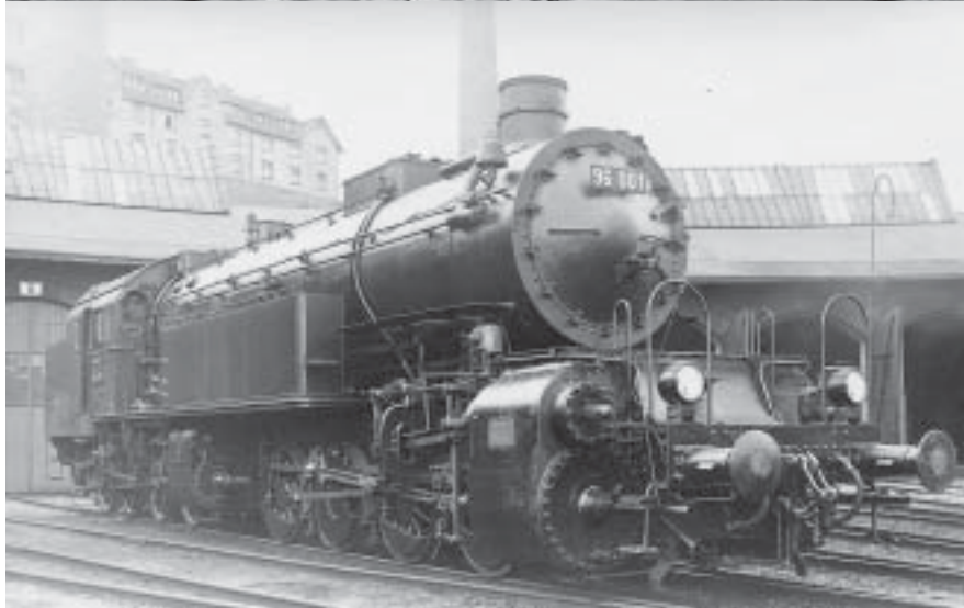
ganz oben: Zwischenzeitlich zur BR 96 024 mutiert, präsentiert sich die ehemalige Gt2x4/4 5774 am 19. Juni 1933 im Bw Pressig.