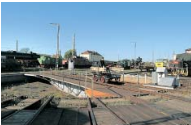
Mit der Handhebeldraisine (oben) oder mit der Köf (unten) können Sie das weitläufige Gelände des Bayerischen-Eisenbahnmuseums »erkunden«.