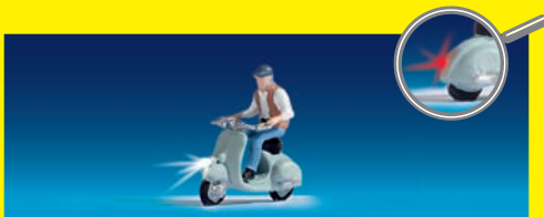
HO 17511 Motorrollerfahrer , Fahrzeug ausgestattet mit Scheinwerfer und Rücklicht € 19,99

Zukunftssicher: Nach 30 Jahren übernimmt ein neuer Decoder die Adressierung der Magnetartikel. Der m83 (Art. 60831) ist dank Software-Updates auch für die Zukunft bestens gerüstet.