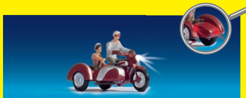
HO 17514 Motorradfahrer , Fahrzeug ausgestattet mit Scheinwerfer und zwei Rücklichtern € 24,99