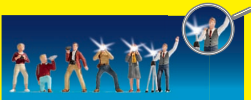
HO 17520 Fotografen , 6 Figuren, 3 davon ausgestattet mit blitzenden Kameras; Blitzlicht-Elektronik enthalten € 39,99