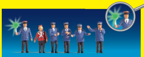
HO 17540 Bahnpersonal , 6 Figuren, 1 davon ausgestattet mit grüner Dauerlicht-Kelle € 19,99