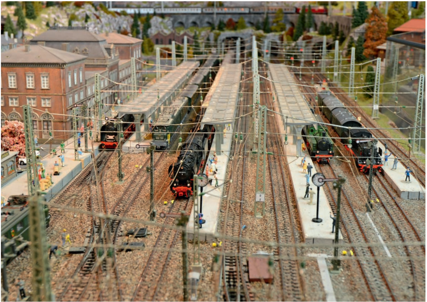
Zahlenspiel: Theoretisch lassen sich am neuen Digitaldecoder 512 verschiedene Kombinationen einstellen.

Zukunft reagieren soll. Diese Programmierung wird über einen zehnstelligen Codierschalter erledigt. Neun dieser Codierschalter sind für die Einstellung der Adresse zuständig, während der zehnte Schalter die Betriebsart vorgibt. Steht dieser Schalter in Stellung „off“ (= unten), reagiert der Decoder auf das Märklin-Digitalsystem und damit auf Geräte wie etwa die Central Station 6020, die Control Unit 6021, die Central Station 60212 bis 60215 oder die Mobile Station 60653. Wird der Schalter hingegen auf Stellung „on“ (= oben) gestellt, reagiert dieser Baustein ab sofort nur noch auf die Schaltbefehle eines DCC-Systems.